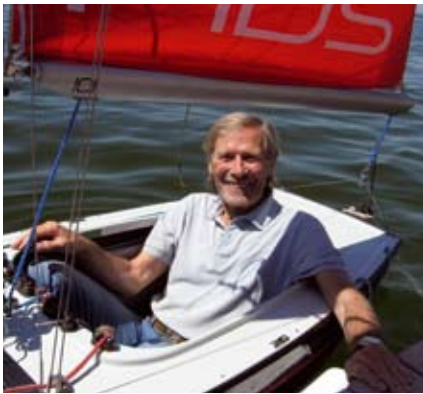
Schauspieler Horst Janson probiert die behindertengerechten Mini-12er Boote aus.